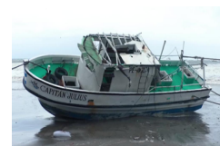
Alertan en Nicaragua por fuertes lluvias, oleaje y