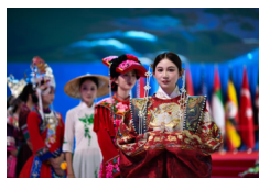
Semana de la moda durante la Exposición China-Sur de Asia en Kunming, Yunnan