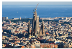
España: Gaudí y sus obras maestras del modernismo catalán