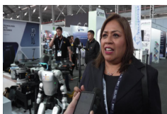
Peruanos destacan innovación tecnológica china presente en