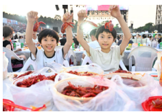
Festival del cangrejo de río impulsa el consumo en Xuyi, Jiangsu