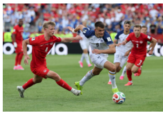
Canadá empata 1-1 con Bosnia-Herzegovina en Copa Mundial de FIFA