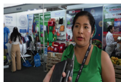
Empresas peruanas apuestan a la cooperación con China para