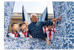
China celebra diversas actividades para conmemorar Día del Patrimonio Cultural y Natural