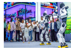
La X Exposición China-Sur de Asia abre sus puertas en Kunming, Yunnan