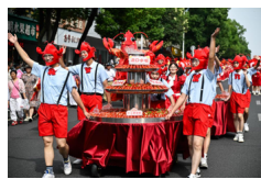
Desfile temático de cangrejos de río en Xuyi, Jiangsu