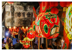
Linternas con forma de pez iluminan una aldea de Anhui